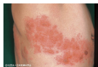
胸部にできた带状疱疹

VZVは加齢だけでなくストレス・疲労などで免疫力が低下した時などに活性化し、带状疱疹としてあらわれます。带状疱疹は以前は体力の低下してくる高齢者に多く見られていました。しかし、少子化で兄弟や子供の水疱瘡に接する機会が減ったことや、ストレスを感じる若い世代が増えたことなどが原因となり、発症のピークは20歳前後と60歳以降に見られるようになっていきました。日本人の6~7人に1人が一生に1回は罹患する疾患で、再発する例もごく稀にありますが、通常は一生に1回しかかからない疾患です。「带状疱疹はうつるの？」という質問を受けることがありますが、水疱瘡にかかったことのない乳幼児に水疱瘡としてうつる場合はありますが、带状疱疹そのものが人にうつることはありません。